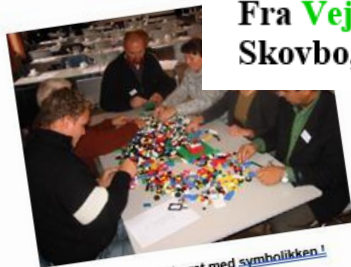
Der arbejdes koncentreret med symbolikken!