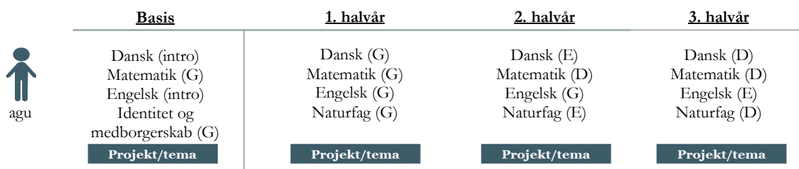
Figur: Eksempel på indholdselementer i elevforløb på almen grunduddannelse

Eleven kan gå til afsluttende prøve i de almene fag på de niveauer, som fagene udbydes på, hvilket kan være G-, E- eller D-niveau. Prøverne bedømmes med en karakter efter 7-trins-skalaen.