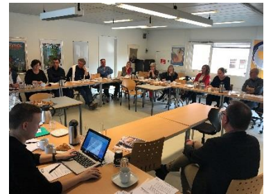
UUV's repræsentantskab lyttede interesseret til fremlæggelsen af det succesfulde Campus projekt.