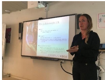
Regions Sjælland har støttet projektet, som i den grad har skabt samarbejde og netværk blandt skolerne på området