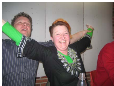
Begejstringen ville ingen ende tage.