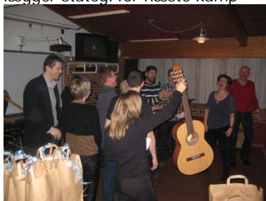
UUV modtager sølvpræmien. Og bryder ud i kampråbet U U V