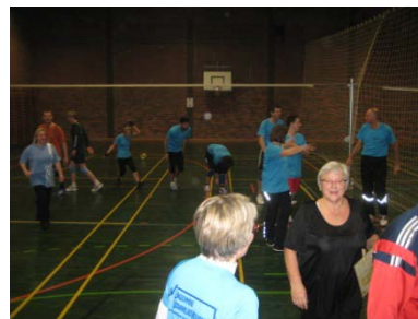
UUV på vej ud af banen efter nok en sejr.